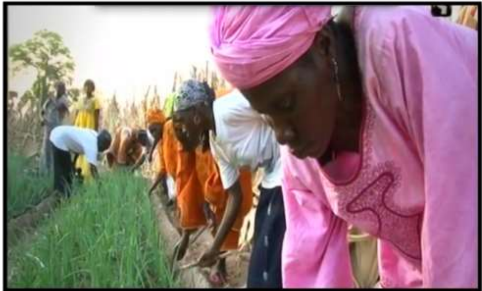
Curso de agricultura ecológica. Microintervención AFRICagua.