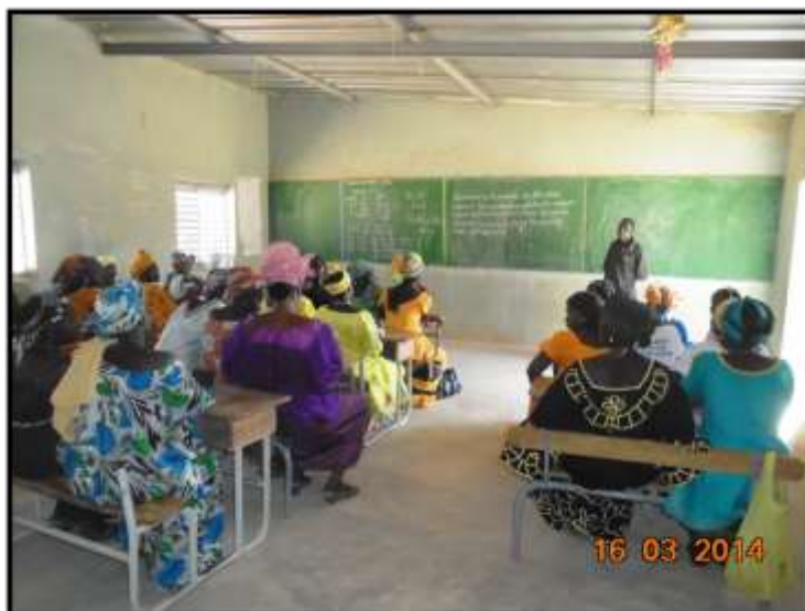
Curso de alfabetización en Diola. Microintervención AFRICagua.