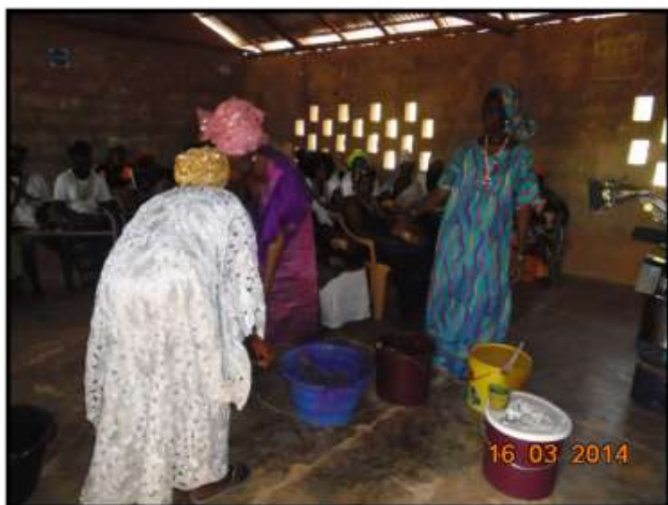
Izqda: Curso de conservas de hortalizas en Boutegol. Microintervención AFRICagua.