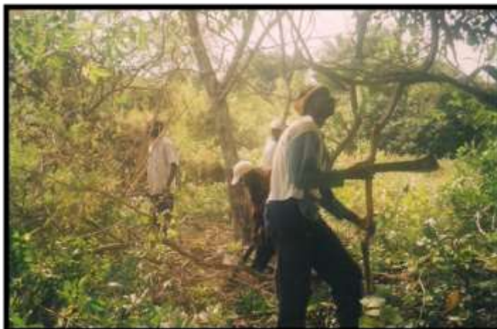
Limpiando el terreno para el proyecto de soberanía alimentaria

Con respecto a proyectos de Codesarrollo, ADIAMAT ha colaborado en la identificación y ejecución del proyecto titulado “Puesta en marcha de una estrategia de desarrollo rural sostenible generadora de empleo, con incidencia en la soberanía alimentaria, en Boutegol (la Casamance), en Senegal”, financiado por la DGA 2013 a la ONGD CERAI.