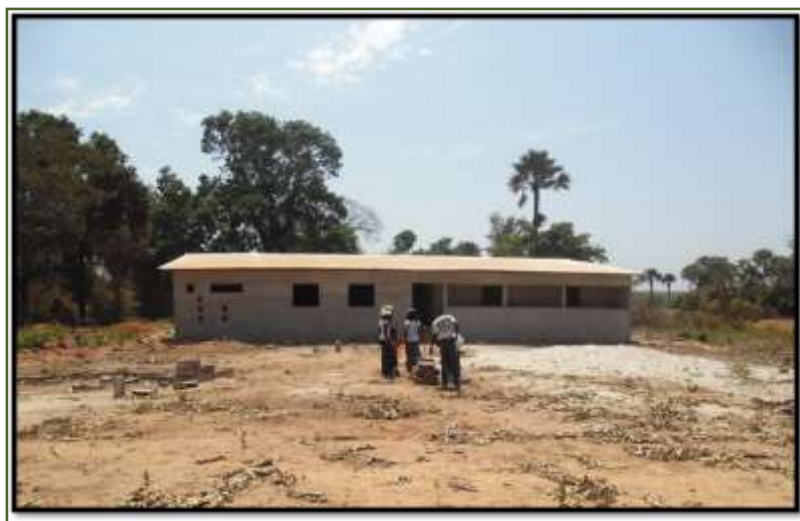
Centro de salud finalizado por la ONGD ARAPAZ-MPDL Aragón

También, participó en la identificación y ejecución de los proyectos de mejora y finalización del centro de salud de Boutegol, financiados por varios ayuntamientos de Zaragoza, entre ellos, los de Ejea de los Caballeros y Utebo, a la ONG ARAPAZ-MPDL Aragón.